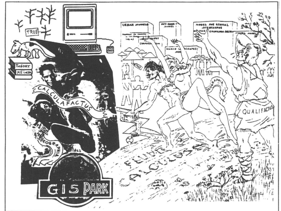
Kuva 2. Geografia – Misericordia!

myös maantieteen sukupuolisuuteen ja moneuteen ( gender & pluralism ): onko kyseessä maantiede (yks. fem.), maantieteet (mon. fem.) tai maantiede/maantieteilijät (mon. mask.). Tiedeyhteisön ylivoimainen maskuliinisuus, valkoihoisuus ja heteroseksuaalisuus on sinänsä jo ongelma ja se voi tiedostaen tai tiedostamatta kahlehtia meitä.