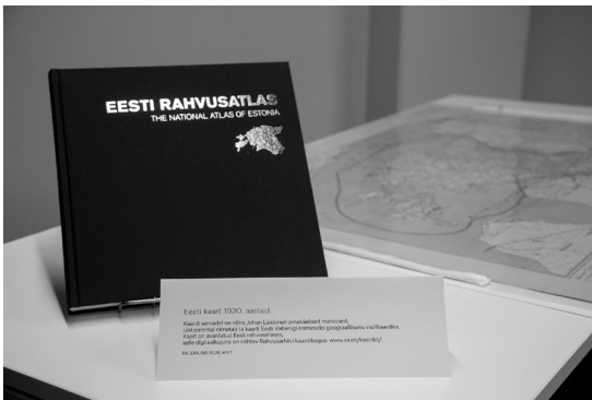
Kuva 1. Viron kansallinen kartasto ( Eesti rahvusatlas – The national atlas of Estonia) esillä julkistustilaisuudessa 19.11.2019 Viron kansallisarkistossa Tartossa.

Virossa juhlistettiin loppuvuodesta 2019 useita korkeakoulutuksen ja maantieteen yliopisto-opetuksen merkkipaaluja. Tarton yliopisto täytti 100 vuotta vironkielisenä yliopistona (vaikka se onkin perustettu jo vuonna 1632) samoin kuin Tarton yliopiston maantieteen osasto. Viron vapaussodan loppuaikana Tarton yliopisto avattiin uudelleen 1.12.1919. Samalla aloitettiin myös vironkielinen yliopisto-opetus. Tarton yliopiston juhlavuoden ja viron kielellä annettavan yliopisto-opetuksen kunniaksi virolaiset maantieteilijät päättivät koota itsenäisen Viron historialliset kartat yhdeksi kartastoksi. Esimerkkinä ja innoittajana toimi kansallinen Suomen kartasto , jonka ensimmäinen painos ilmestyi jo vuonna 1899 ja oli laatuaan ensimmäinen maailmassa. Viron kansallinen kartasto Eesti rahvusatlas – The national atlas of Estonia julkaistiin 12.11.2019 Tallinnassa. Toinen esitys pidettiin Tartossa 19.11.2019 (kuva 1).