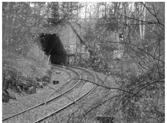
Kuva 8. Kuvan alikulkutunnelin edustaa Laurille rajapyykkiä, joka kytkeytyy hänen elämänsä vaiheisiin lapsuudesta eläkeikään.

Laurin valintamotiivit näyttäisivät siis palautuvan toiminnallisiin ja sosiaalisiin sekä ennen kaikkea nostalgisiin ulottuvuuksiin. Haastattelun perusteella valintamotiiveihin on kuitenkin liitettävissä myös