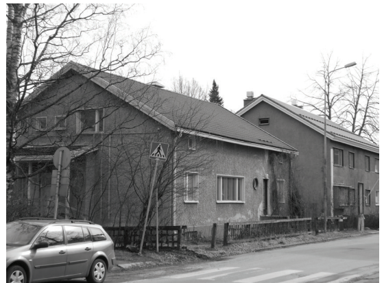
Kuva 3. Saidin tapauksessa paikan tärkeys rakentui van- hojen talojen pittoreskista kauneudesta, henkilökohtai- sista unelmista ja halusta säilyttää kulttuuriympäristön monikerroksisuus.

Jasminin tärkeäksi paikaksi nimeämän Kuokka- lan sillan (kuva 4) valintamotiivit rinnastuvat lähtö- kohtaisesti Mikon vastaaviin. Ne nimittäin pohjau- tuivat arkiseen kulkureittiin sekä paikalta avautu- vaan ”kivaan maisemaan” ja ”hienoihin näkymiin”. Jasminin ottaman kuvan ja paikan tärkeyden pe- rusteluiden lähempi tarkastelu kuitenkin linkittää