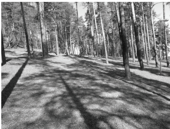
Kuva 7. Harju on Leenalle tärkeä vapaa-ajan viettopaikka, jossa yhdistyvät luonnon kauneus, rauhallinen tunnelma ja nostalgiset muistot.

Lauri valitsi tärkeäksi paikakseen Jyväskylän–Haapamäki-junaradan varrella sijaitsevan Länsi-