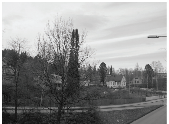
Kuva 5. Pertin paikan valinnassa korostui huoli hänelle tärkeän maiseman katoamisesta.

Varsinainen syy Pertin valintaan on kuitenkin johdettavissa pelkoon, jossa kaupungin kaavailemat kehittämissuunnitelmat uhkaavat hänen mielikuvansa mukaista käsitystä alueen esteettisesti ideaalista ulkomuodosta. Haastattelussa Pertti kertoi, ettei ymmärrä kaupungin tarvetta rakentaa suuria ”kerrostalokolosseja” Älylän välittömään läheisyyteen ja perustella niiden arvoa sillä, että näin pystytään