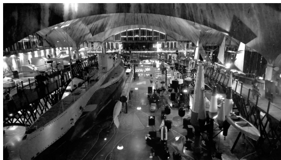
Yleiskuva Viron merimuseosta avajaisillallisella. Oikealla valtava sukellusvene Lembit, edessä siintävät illallis-pöydät. Valaistus oli taianomainen.