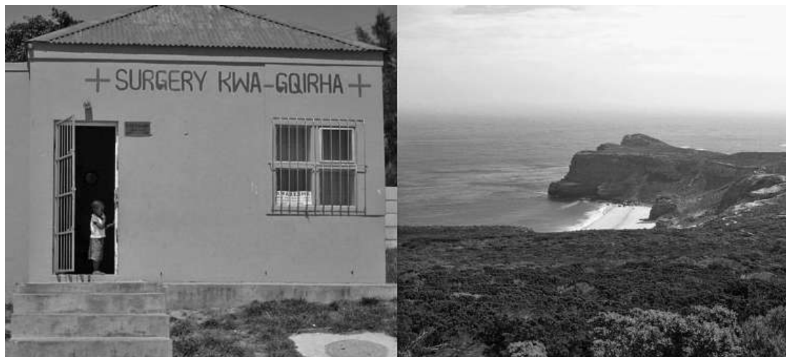
Kuva 5. Vasemmanpuoleinen kuva on otettu Kayamandin townshipissa Stellenboschissa ja oikeanpuoleinen Hyvän-toivonniemeltä. Kuvien esittämät kohteet ovat yhdistettävissä ajatukseen kulttuurista ja luonnosta.

Figure 5. Kayamandi township in Stellenbosch on the left and the Cape of Good Hope on the right. Photos represent features which can be related to the idea of culture and nature.