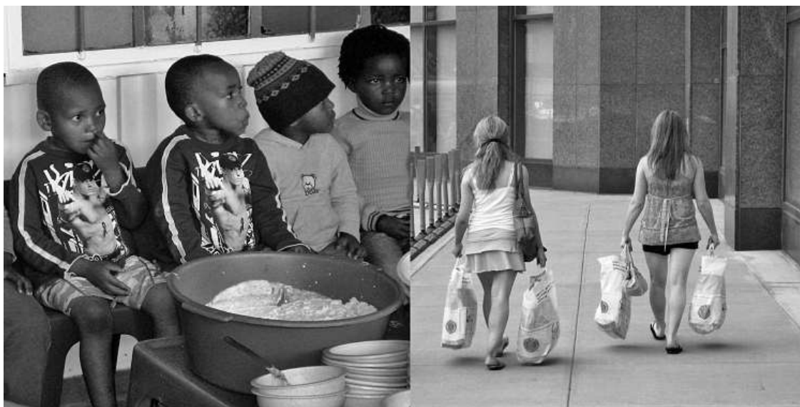
Kuva 2. Vasemmanpuoleisessa kuvassa on esikoululaisia Soweton townshipissa (tummaihoisten eteläafrikkalaisten asuinalueella) Port Elizabethissa ja oikeanpuoleisessa kuvassa on kaksi Century 21 -tavaratalossa ostoksilla käynyttä tyttöä New Yorkin Ground Zero -alueella. Kuvaparin avulla tutkin, voiko valokuvan maantieteellisiä merkityksiä jäsentää konnotaation avulla. (Kuvat: Markus Hilander, 11/07 & 7/08)

Hermeneuttiseen koodiin kuuluvat ne tekstin osat, jotka ylläpitävät kerronnallista jännitettä. Koodi sisältää kysymyksiä ja vastauksia, ongelmia ja niiden ratkaisuja sekä yllättäviä tapahtumia. Kysymysten avulla katsoja pyrkii antamaan ensisilmäyksellä käsittelemättömältä näyttävälle tilanteelle selityksen. Monet mainokset hyödyntävät hermeneuttista koodia muotoilemalla viestinsä arvoitukseksi, kysymykseksi tai ongelmaksi, johon mainostettava tuote on vastaus tai ratkaisu. Tällöin tuote asetetaan toimijan rooliin: se pelastaa ja auttaa katsojaa muuttamaan elämäänsä kuluttamisella. Jos odotusten mukaista ratkaisua ei löydy, katsoja jää etsimään vaihtoehtoja tulkintaa (Barthes 1990: 19;