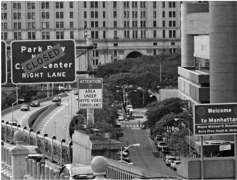
Kuva 6. Näkymä Brooklynin sillalta Manhattanille. Kuvan avulla selvitin, miten merkien sijoittelu vaikuttaa opiskelijoiden tarkkaavaisuuteen ja merkitysten muodostumiseen. Figure 6. View of Manhattan from the Brooklyn Bridge. With the help of this photo, my aim was to research what sort of impact the signs will have to students' vigilance and to the signification system.

tion etsimistä ympäristön kohteista (Mustonen 2001: 26; Malmelin 2003: 92). Kuvissa näkyvien paikannimien perusteella voidaan esimerkiksi tehdä päätelmiä miljööstä, sillä yleensä paikannimellä viitataan johonkin ympäristön olennaisista elementeistä. Esimerkiksi "Manhattan" tarkoittaa monien mäkien saarta (Huuskonen 1995: 177).