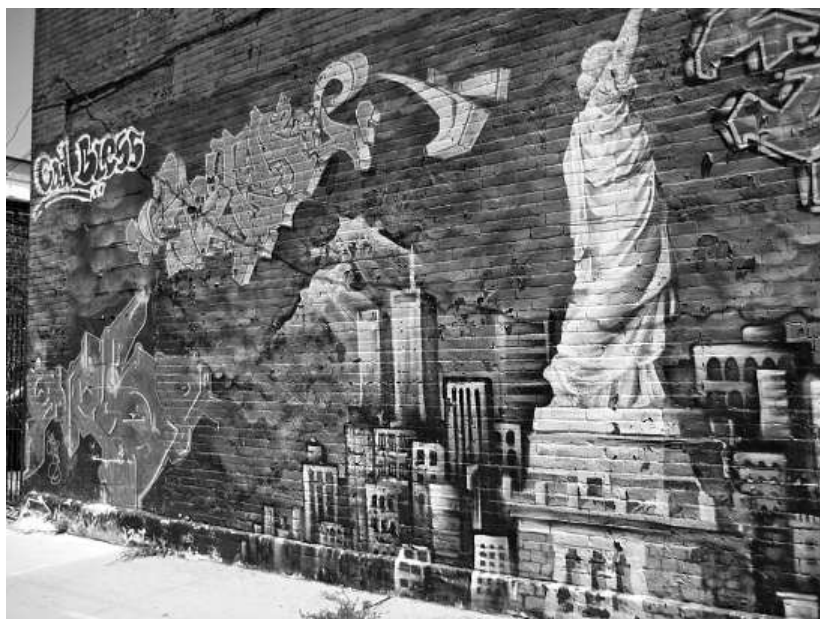
Kuva 4. World Trade Centeriä ja Vapaudenpatsasta takaapäin kuvaava graffiti Brooklynissa.

89 prosenttia opiskelijoista kirjoitti tekstiviestissään aikaulottuvuudelle sijoittuvan tarinan. He kirjoittivat muun muassa toivosta ja paremmasta tulevaisuudesta, yhteiskunnallisesta kriittisyydestä, saasteista, ilmastonmuutoksesta ja myrskystä, jengielämästä, isänmaallisuudesta sekä uskonnosta. Esimerkiksi 16-vuotias tyttö kirjoitti näin: ”Köyhä perheenisä asui New Yorkin slummissa perheensä kanssa. Elämä näytti synkältä mutta Vapaudenpatsas antoi toivoa ja isä sai työpaikan ja perhe voi paremmin.” Vain kahdeksassa prosentissa tekstiviesteistä kuvattiin WTC:n tuhoa ja