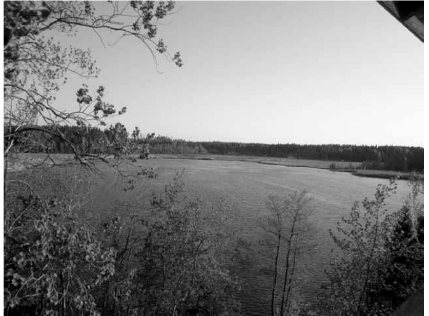
Figure 2. A view from the bird tower over the southwestern part of Lake Ekojärvi. The open water is bordered by flood meadows, an important habitat type for wetland birds. Photo: Jouko Mustalahti, 05/11)

merkitystä. Näkö- ja kuuloaistin antamat vihjeet linnuista tarjoavat yhdessä tarkempaa tietoa kuin kumpikaan aisti yksinään. Lintujen laulu ja muut äänet ovat usein näköhavaintoja tärkeämpiä lintujen havaitsemisen ja tunnistamisen kannalta. Äänen erottaminen toisistaan vaatii rutiininomaista keskittymistä, sillä lintujen yhtäaikainen kuoro synnyttää peittovaikutuksen, joka haittaa etenkin korkeimpien äänten kuulemista ja erottamista.