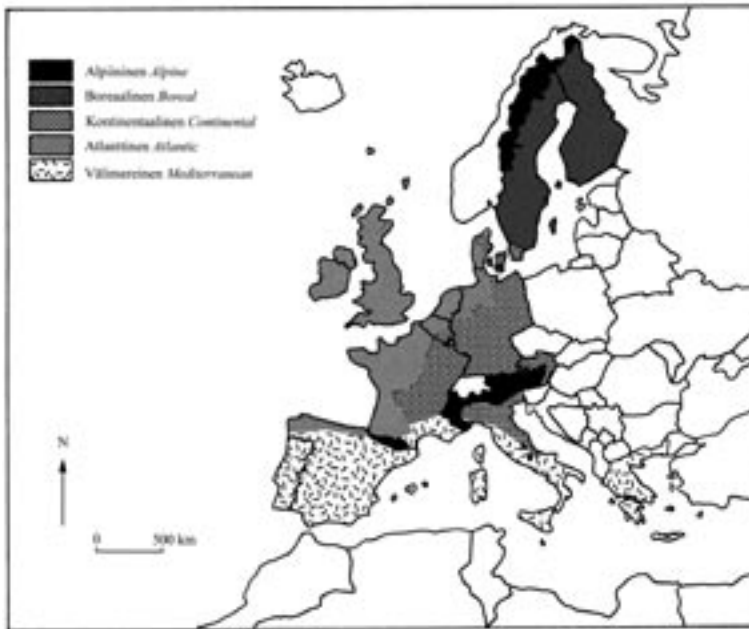
Kuva 1. Euroopan unionin biogeografiset alueet (Ilmonen ym. 2001: 10). Kartasta puuttuu Makaronesia, joka käsittää Kanarian saaret, Madeiran ja Azorit.

Figure 1. Biogeographical regions of the European Union, excluding Macaronesia, which comprises the Canary Islands, Madeira and the Azores (Ilmonen et al. 2001: 10).