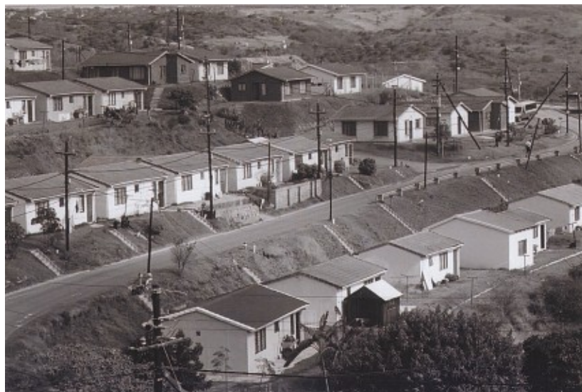
Kuva 1. Cato Manorin taloja on uudistettu valtion ja kunnan lainoin.

Kaikkialla valkoisten levittäytyminen ei suinkaan sujunut ilman vastarintaa. Hyvinä esimerkeinä ovat Kapkaupungin keskustan kerrostalo-