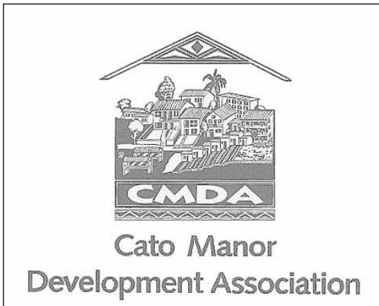
Kuva 2. Cato Manorin kehitysliiton tunnus.

alue District Six ja Durbanin Cato Manor, joissa asukkaiden painokas vastarinta jäädettiin rakennushankkeet koko apartheidin ajaksi. District Six on vielä tänä päivänäkin laajalti entisessä asussa, sen sijaan Cato Manor on muuttunut täysin entisistä ajoista.