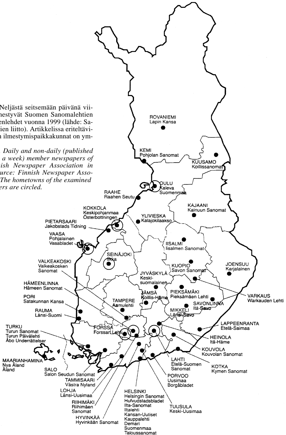
Figure 1. Daily and non-daily (published 4–7 days a week) member newspapers of the Finnish Newspaper Association in 1999 (source: Finnish Newspaper Association). The hometowns of the examined newspapers are circled.

Kuva 1. Neljästä seitsemään päivänä viikossa ilmestyvät Suomen Sanomalehtien liiton jäsenlehdet vuonna 1999 (lähde: Sanomalehtien liitto). Artikkelissa eriteltävien lehtien ilmestymispaikkakunnat on ympyröity.