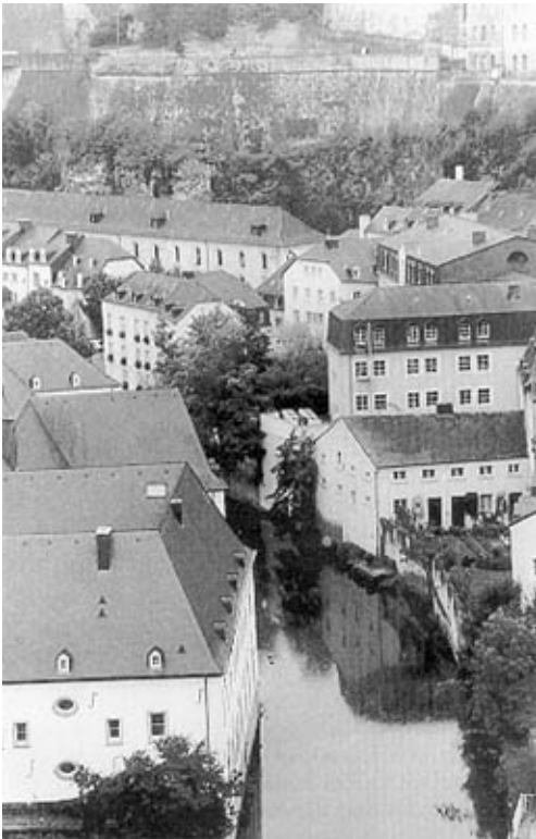
Kuva 1. Luxemburgin kaupungin halki virtaava Alzettejoki sekä vanhaa kaupunkia ympäröivä linnoitus. (Kuva kirjoittajan, 09/98)

Pääosa suurherttuakunnan pääkaupungista Luxemburgista sijaitsee Alzettejoen tasoa selvästi korkeammalla jyrkkärinteisellä alueella, kun taas teollisuusalueet keskittyvät jokilaaksoon. Kaupungin kehityksessä ratkaiseva on ollut 900-luvulla rakennettu linnoitus, jonka jäänteet ympäröivät edelleenkin Luxemburgin vanhaa kaupunkia (kuva 1).