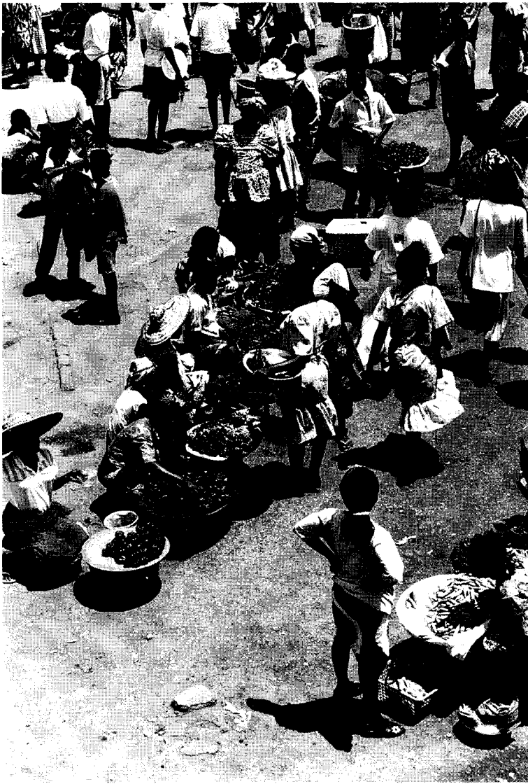
Kuva 2. Torikauppa kukoistaa Ghanan kaupungeissa. Kuvassa Kaneshi-tori Accrassa.

Figure 2. Small petty trade flourishes in Ghana's cities. The picture is of the Kaneshi market in Accra.