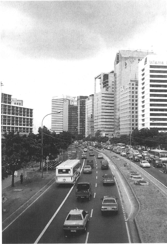
Kuva 2. Indonesian talousuudistusten seurauksena pääkaupunkiin Jakartaan (n. 13 milj. as.) etabloituu yhä useampia kansainvälisiä pankkeja ja yhtiöitä.

Fig. 2. After deregulations in the Indonesian economy, a greater number of international banks and companies are established in the capital Jakarta (popul. 13 mill.).