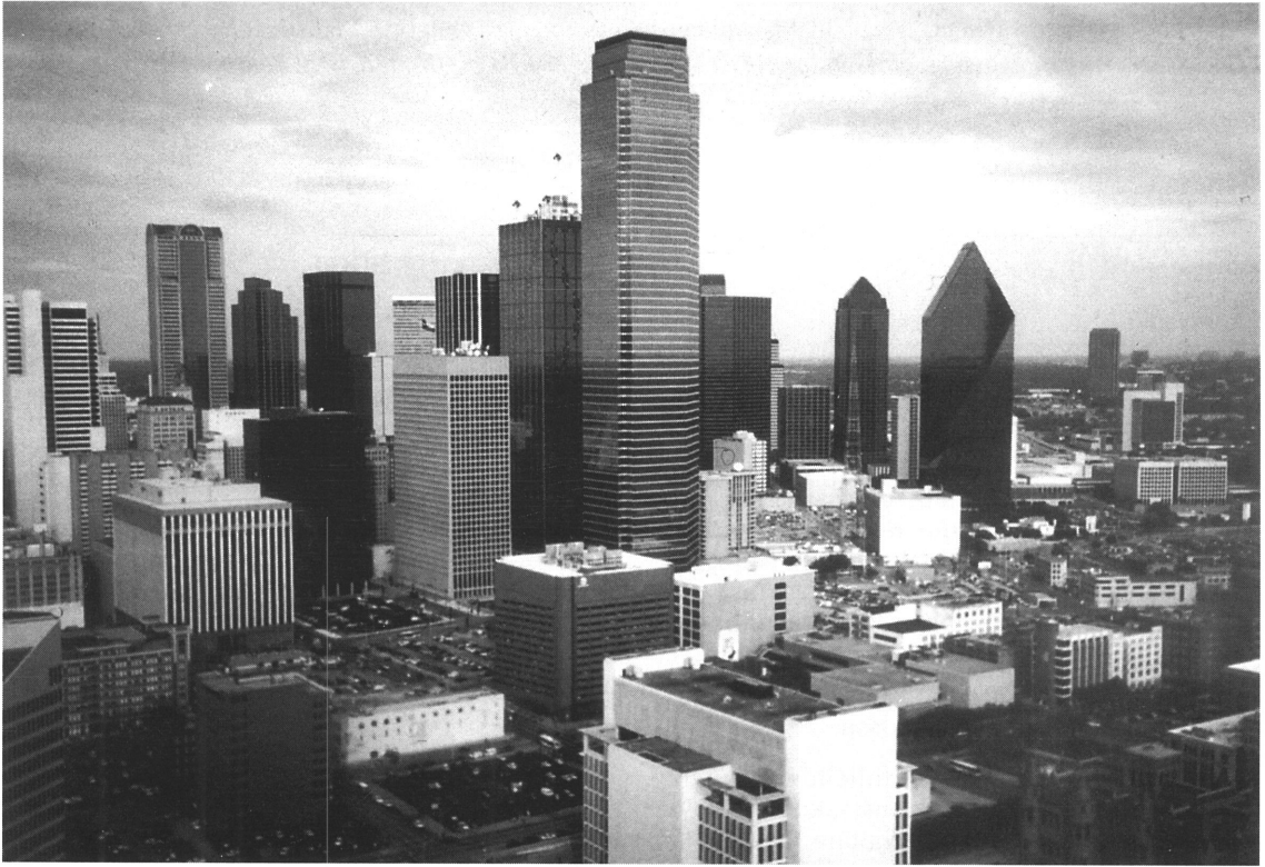
Kuva 3. Nafta saa kannatusta erityisesti Teksasissa, missä ulkomaankaupan Meksikon kanssa odotetaan kasvavan huomattavasti. Dallas on maiden välisten ilmakuljetusten solmukohta.

Fig. 3. NAFTA gets support particularly in Texas, where the trade with Mexico is expected to grow considerably. Dallas is the node of the air transportations between the countries.