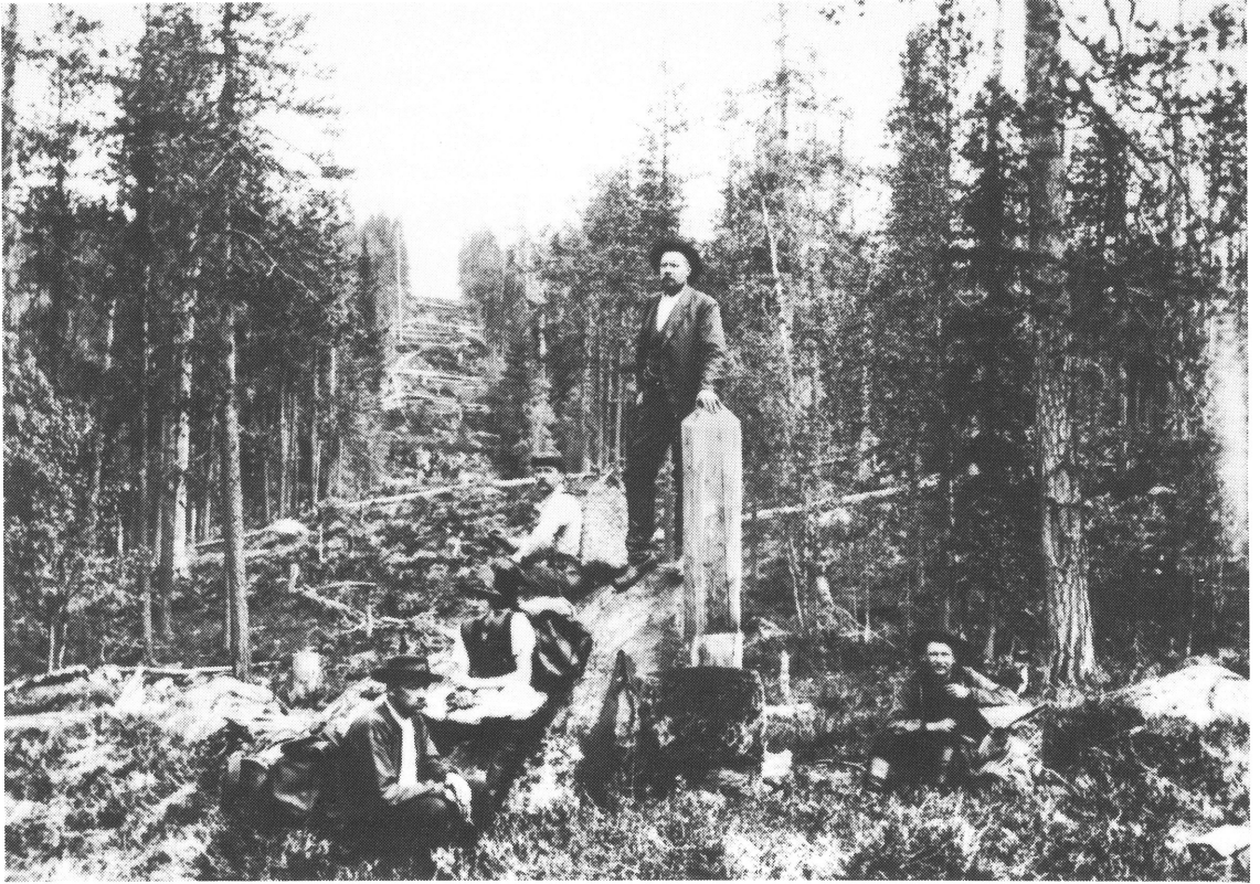
Kuva 1. Tunnettu valokuvaaja ja etnografi Samuli Paulaharju (toinen vasemmalta) matkatovereineen lepotaulla rajapyykillä matkalla Vienaan 1910.

Fig. 1. The well-known Finnish photographer and ethnographer Samuli Paulaharju (second from left) and his colleagues resting at the border on the road to Dvina in 1910.