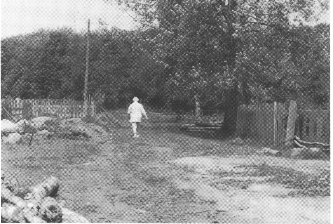
Kuva 4. Kadonneita juuria etsimässä Vanhassa Värtsilässä (valokuva kirjoittajan, 10. 6. 1992). Fig. 4. Searching for lost roots in Old Värtsilä (Photographed by the author on 10th June 1992).

Itä-Euroopan muutos on tunnetusti koskettanut syvästi Suomen taloutta. Suomen ja Neuvostoliiton idänkauppa alkoi vähentyä jo ennen Neuvostoliiton hajoamista mutta vasta viime mainitun myötä Suomen idänkauppa kokonaisuutena katsoen romahti. Muutos idänkaupan parhaimpien aikojen 15 % osuudesta koko Suomen ulkomaan kaupasta muutamaan prosenttiin on ollut raju.