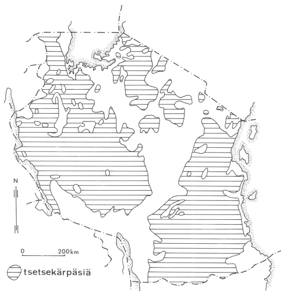
Kuva 3. Tsetsekärpäsen levinneisyys Tansaniassa.

hipiiristä. Tansanian tämän hetkisen yleisimmän viljelytekniikan, kuokkaviljelyn, avulla ei ihminen kuitenkaan saa ympäristöstä kyllin vahvaa otetta pystyäkseen tehokkaasti avaamaan tsetsekärpäsen valtaamia seutuja oman käyttöönsä.