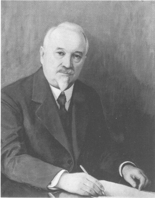
Kuva 2. A.F. Ripatin maalaama muotokuva Iivari Gabriel Leiviskästä vuodelta 1936. Galleria Academica, Helsingin yliopiston kokoelmat.

Fig. 2. Iivari Gabriel Leiviskä in 1936, painting by A.F. Ripatti. Galleria Academica, collections of the Helsinki University.