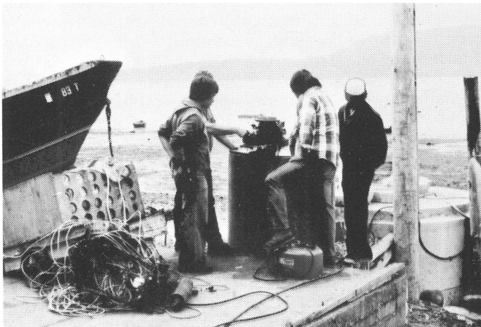
Kuva 3. Intiaanioppilaita Lummi-intiaanien vesienviljely- ja kalastuskoulun konepajalla.

Lummien aineellisen ja henkisen kulttuurin suotuisa kehittyminen ei riipu yksin heistä itsestään vaan myös ulkopuolisten päätöksistä ja asenteista. Esimerkiksi Yhdysvaltain kongressin rahapolitiikka säätelee lummien suunnitelmien toteutumista. Rahoittaahan Liittovaltio mm. lummien peruskoulutuksen ja terveydenhoidon. Tietoisina asemastaan lummit pyrkivät parantamaan myös yleistä suhtautumista alkuperäiskansoihin.