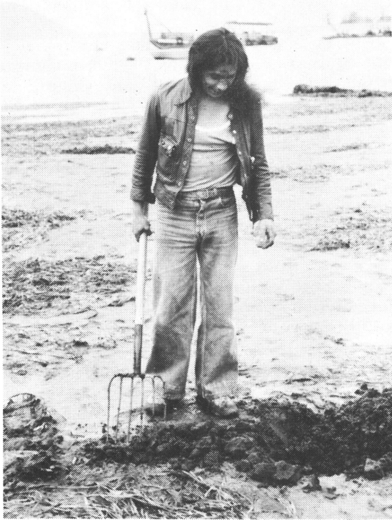
Kuva 2. Intiaaniopiskelija kaivaa simpukoita vuoroveden paljastamalta rantavyöhykkeeltä Lummi-intiaanien vesienviljely- ja kalastuskoulun edustalla Lummisaarella. Kirjoittajan kuva 3. 6. 1981.

Fig. 2. An Indian student is digging clams during the low tide on the seashore close to the Lummi Indian School of Aquaculture and Fisheries in Lummi Island. Photographed by the author on June 3, 1981.