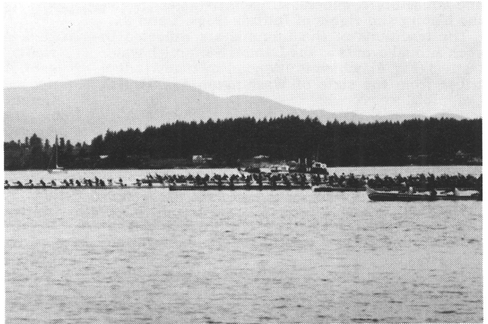
Fig. 4. The canoe race of 6.5 miles for men at Lummi Stommish water festival has begun; Lummi word »stommish» means »great warrior». The 11-man war canoes, 17 metres in length, have been carved out of western redcedar, the sacred tree of the Lummi Indians. Only some of teams of different tribes are visible in the picture. Photographed by the author on June 27, 1981.

Kuva 4. Lummi Stommish (stommish = suuri soturi) vesijuhlien miesten kanoottikilpailu on alkanut. Kaikkiaan 24 kanoottia, kussakin 11 hengen miehistö, syöksyy 6,5 mailin taipaleelle. Pyhästä jättiläistuijasta kaiverretut sotakanootit ovat 17 metriä pitkiä. Kuvassa näkyy vain osa eri intiaaniheimoja edustavista joukkueista. Kirjoittajan kuva 27. 6. 1981.